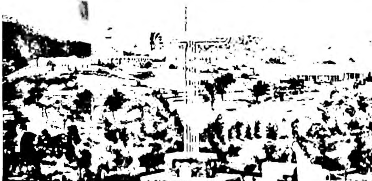
Il Cimitero degli Eroi, a Cheren, dove vennero sepolti 5.000 soldati italiani e 8.000 ascari. È qui che è stata raccolta la terra benedetta che è custodita nell'urna a forma di croce incastonata nel cippo esistente al Bosco delle Penne Mozze.

aderenti molti reduci dell'"Uork Amba", e ai quali si è aggiunta la larga partecipazione dei